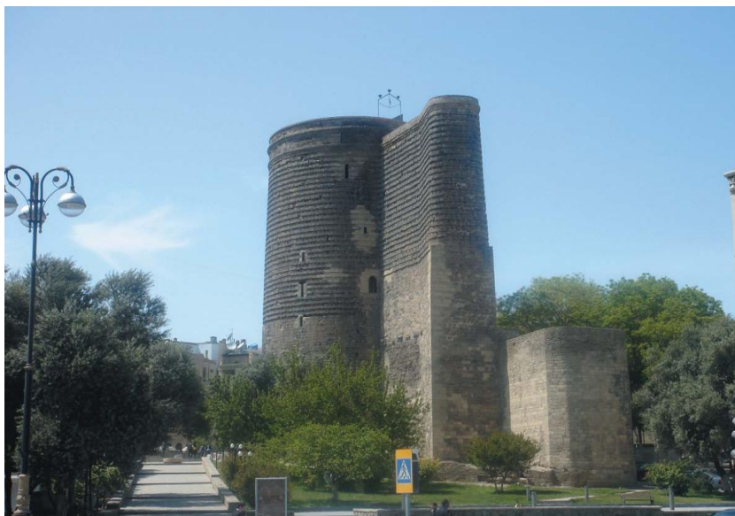
巴库最著名的古迹、世界文化遗产——少女塔

阿塞拜疆居民主要信奉伊斯兰教（什叶派），但不强调教派间差异。俄罗斯、亚美尼亚、格鲁吉亚等少数民族信奉基督教。穆斯林重要节日如“古尔邦节”“开斋节”“纳乌鲁兹节”（春节）以及俄罗斯、东欧节日等都是法定公众假日。