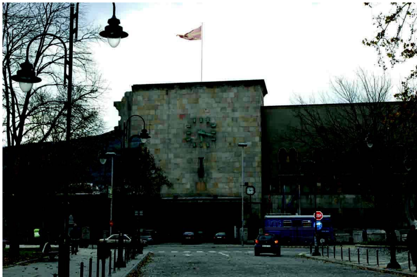
斯科普里市马其顿地震博物馆，1963年大地震后遗留的残垣断壁仍清晰可见