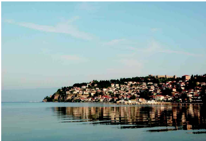
奥赫里德市老城,山顶为塞缪尔城堡遗址

自1993年以来,马其顿陆续成为了世界银行和国际发展协会的成员国,并于2003年加入世界贸易组织。