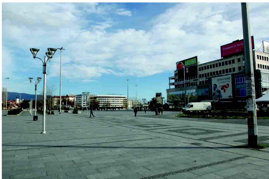
斯科普里市中心“马其顿广场”

首都斯科普里是马其顿政治、经济、文化和交通中心，位于马其顿西北部，海拔240米。斯科普里四周高山环绕，瓦尔达尔河贯穿整个城市，夏季炎热干燥，冬季寒冷湿润，全年平均温度13.7℃。斯科普里现有人口约61万。该市是巴尔干半岛通往爱琴海和亚得里亚海的重要交通枢纽，是全国最大烟草加工中心，还有冶金、机械制造（汽车、农业机械等）、化学、电气器材、水泥、玻璃等工业。这里还以金银饰品等手工艺品闻名。斯科普里大学是马其顿最大的综合性大学，为马其顿培养了大批专业技术人才。